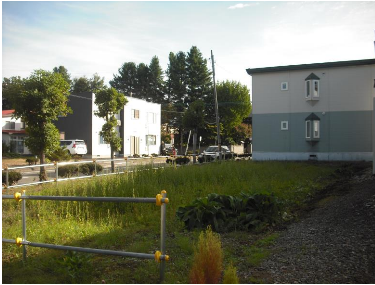
現況写真(北西道路より撮影)