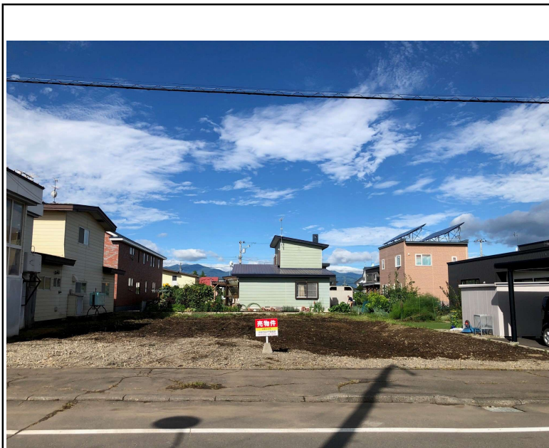
令和5年8月上旬 解体済み